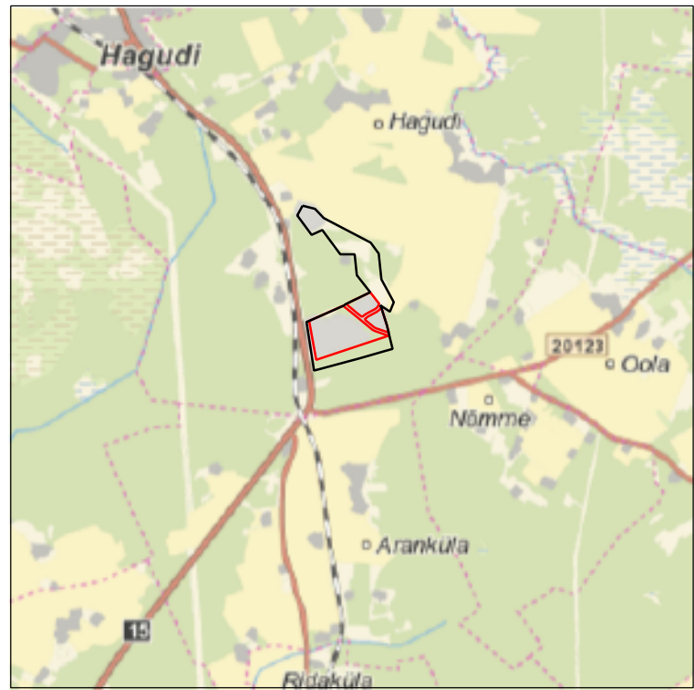
Kaardileht nr 6314 (Rapla)